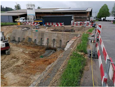
Aushub- und Sicherungsarbeiten 09.05.2023