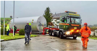
02.11.2023 Anlieferung Speichersilo