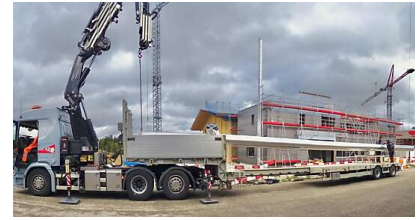
31.10.2023 Anlieferung Kamine