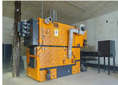
Heizung (HV Weieracker)