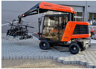
05.04.2024 Steine verlegen