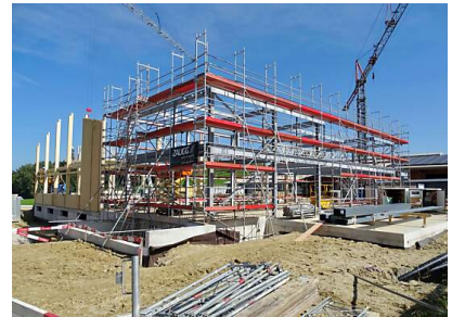
27.09.2023 Halle Flückiger Hecht in Stahl, Halle HP Lanz in Holz