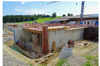
20.07.2023 Decke Heizzentrale