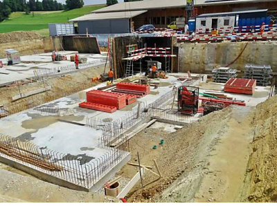
Erste Stellwände 20.06.2023