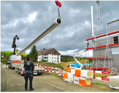
31.10.2023 Anlieferung Kamine/2