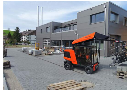
Vorplatz von WV und Flückiger Hecht AG