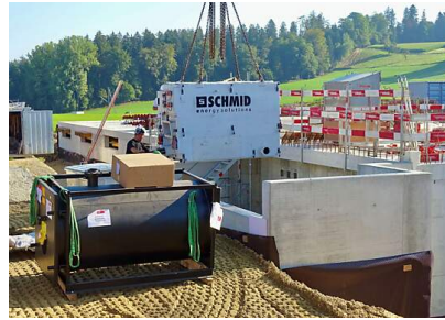
11.09.2023 Einbringen der Heizelemente