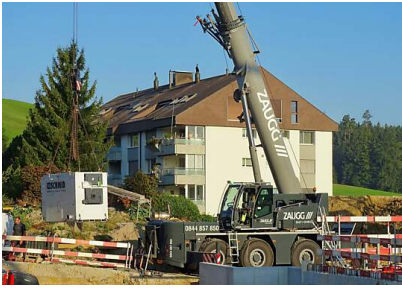
11.09.2023 Anlieferung Heizelemente