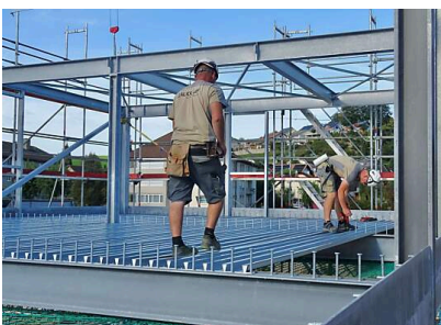
28.09.2023 Halle FH; Bodenprofile montieren