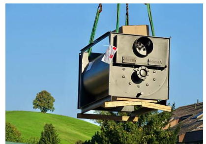
11.09.2023 Anlieferung Heizelemente