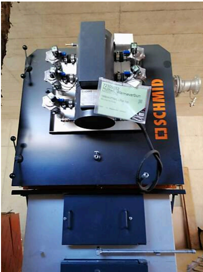
11.09.2023 Montage Heizofen