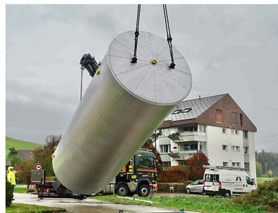
6 Tonnen schwebend