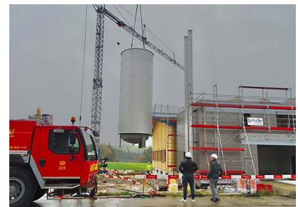
Platzieren = Feinarbeit