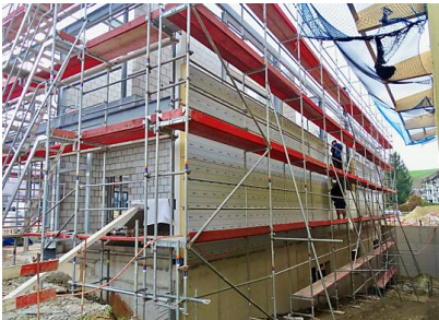
18.10.2023 Gebäudehülle Flückiger Hecht