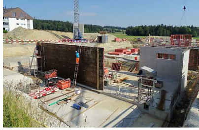
Schalung der Zwischenwand 25.06.2023