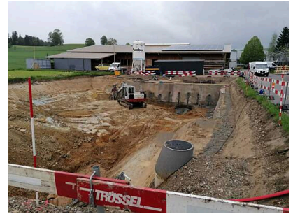
Aushub- und Sicherungsarbeiten 09.05.2023