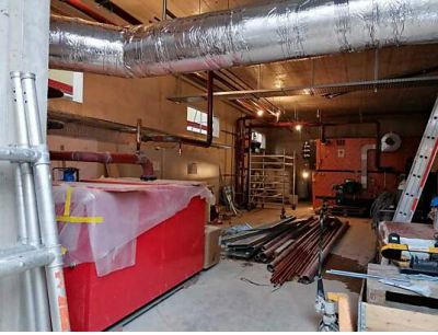
04.11.2023 Montage im Heizraum