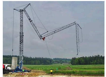
Aufbau des Krans 22.05.2023