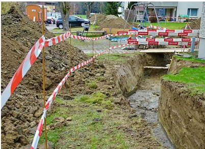
01.03.2024 Graben für Wärmeleitung