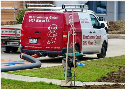
29.02.2024 Leitungsrohre verlegen